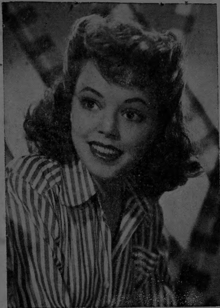
La pelirroja y atractiva Jean Porter es toda una veterana de las tablas y la pantalla. La inteligente actriz, ahora bajo contrato en los Estudios Metro-Goldwyn-Mayer, hizo su debut teatral a la edad de tres años.

Jean Porter es una diminuta y linda comprobación del adagio: "De lo bueno poco". Si su dinamismo, personalidad y talento pudieran pesarse, pesaría una tonelada. Sin embargo, pesa solamente 44 kilos y mide 1.52 mts. de estatura... Tiene una sedosa cabellera rojo-cobre... grandes ojos castaños... y su cuer-