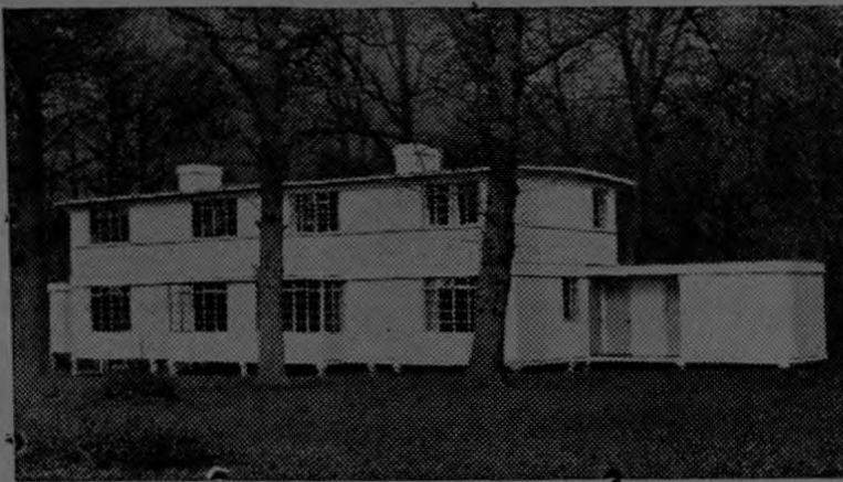
La foto muestra uno de los edificios prefabricados expuesto en Timbel Hill, Inglaterra. Como ésta casa se ha fabricado centenares en Inglaterra con el fin de aminorar la escasez de viviendas causada por la acción aérea del enemigo.